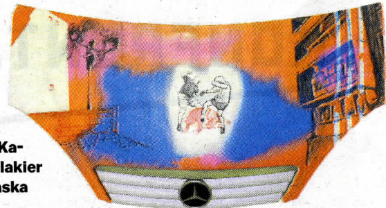
● Sebastian Krok, Kamera, 2019, akryl, lakier samochodowy, maska samochodu